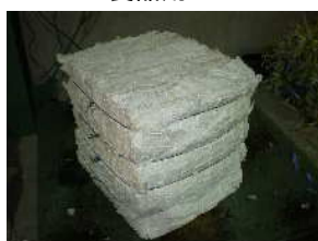
500 x 500 x 500 mm (50-60kg)