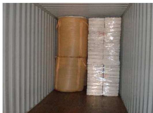
コンテナに荷積みする圧縮されたビニール