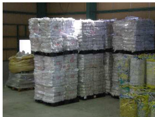
圧縮され、きれいにストックされています