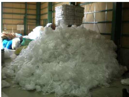
かさばるビニール