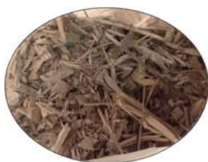
● 木材 ●