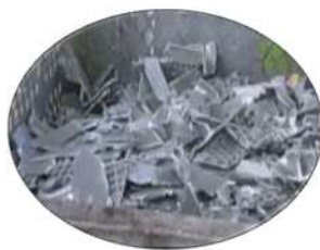
● コンテナボックス ●