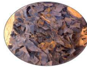
● ホース ●