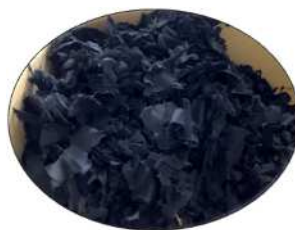
● フェルト ●