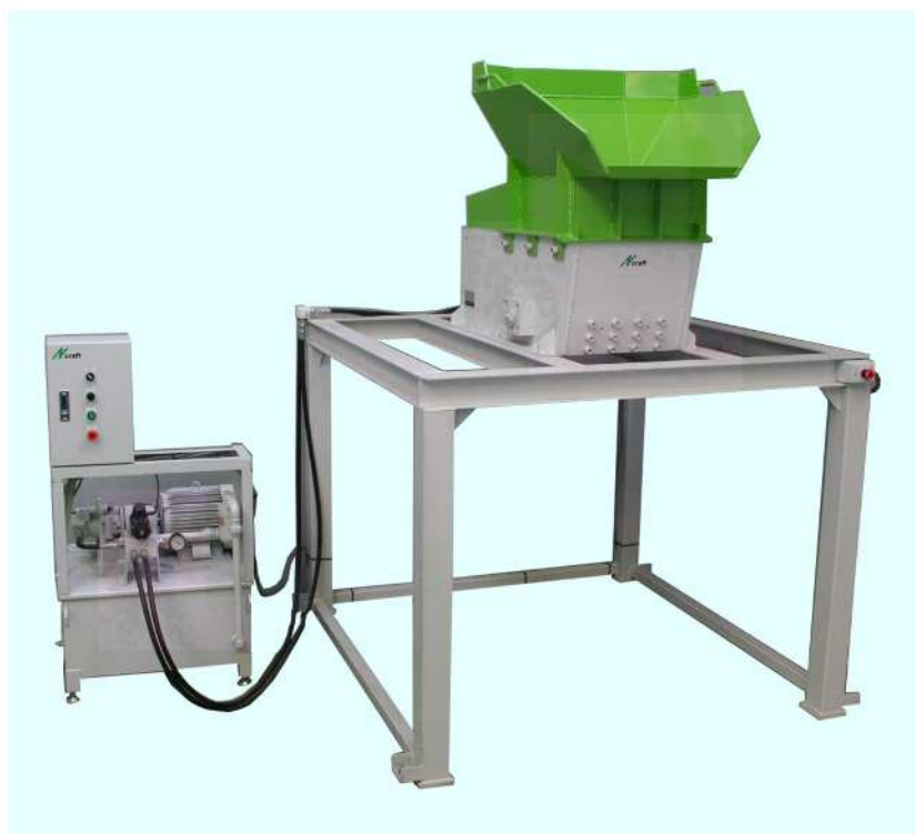
(架台オプション ワイド仕様)