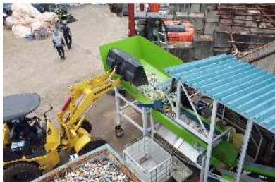
◆パールローダーで投入◆