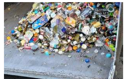
◆取り除かれた異物◆

異物の中には、缶詰の蓋やライター、瓶の破片など、危険物がたくさん含まれています。